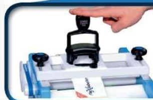
Kit di timbratura Kit stamp Kit de estampación

Dimensione caratteri 3 - 4 mm Character size 3 - 4 mm Tamaño de letra 3 - 4 mm