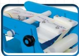
Mensola guida Carta Rail shelf Kit guida de papel