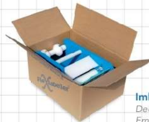
Imballo dedicato Dedicated packaging Embalaje dedicado