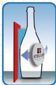
Kit bottiglie champagne Kit Champagne bottle Kit botella champagne