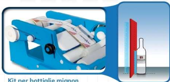
Kit per bottiglie mignon Mignon Kit Kit botella mignon