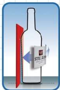
Kit bottiglie coniche Kit conical bottle Kit para botella conica